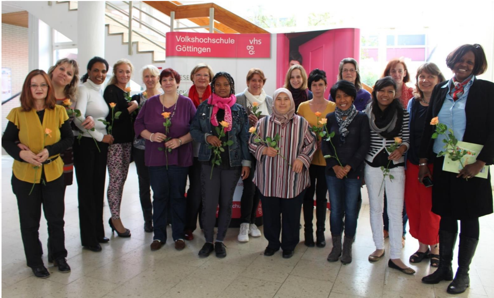
Erfolgreiche Teilnehmerinnen - Zeugnisübergabe am 29.09.2014